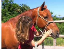
** Il éveille

Dû à la demande, on revient pour la deuxième fois cet été!!