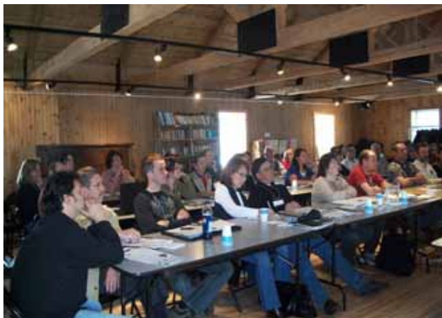
Plus de 25 clubs équestres représentés