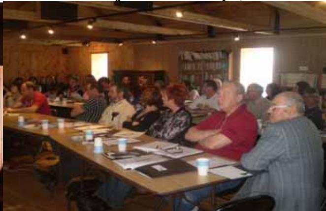
Plus de 50 participants