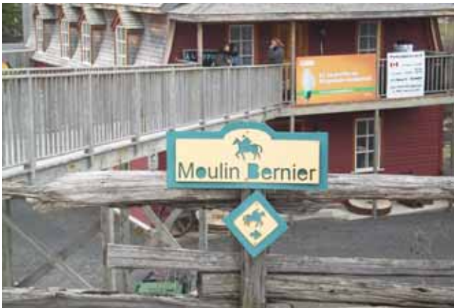
Vendredi 16 avril (veille du Colloque)

Le COLLOQUE des clubs équestres, un succès ... malgré dame nature !