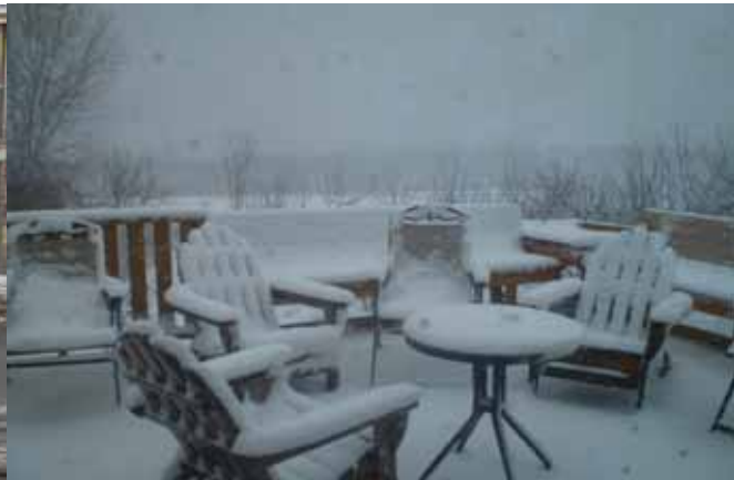
Samedi 17 avril (journée du Colloque)